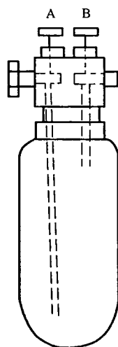
图 1 取样钢瓶

4.1.1 取样钢瓶，见图 1，不锈钢制成，有效体积不小于 1 L，耐压不小于 3 MPa。